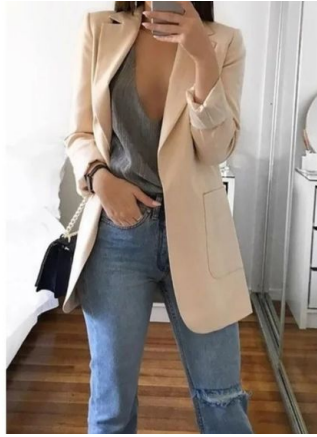
Blazer Sophie Ref: Sophie Precio: $80.000