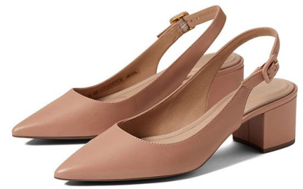
Rockport Total Motion Noelle Sling