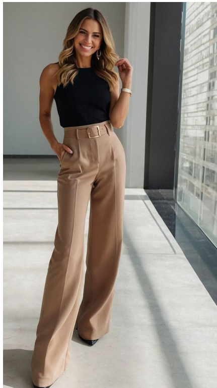
Pantalón Alicia Precio: $80.000