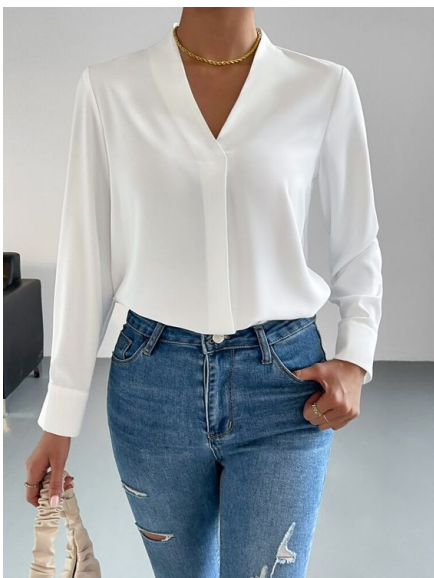
Camisa Gola V