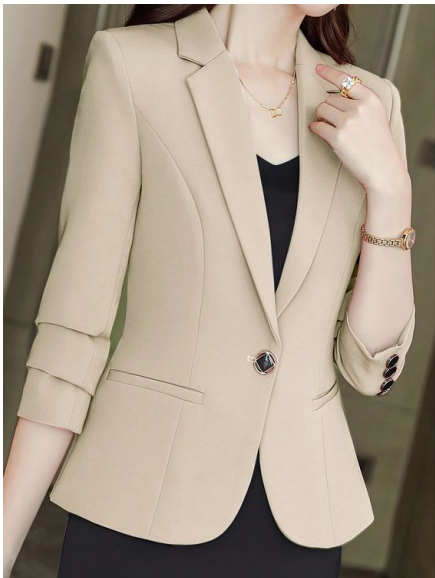
Blazer Manga larga Precio: $130.000