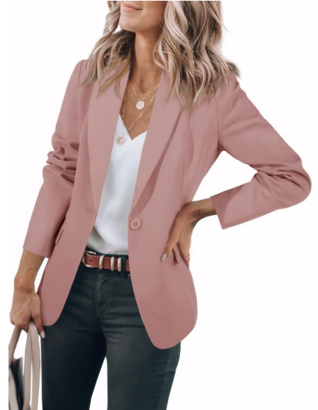
Blazer Cicy bell Ref: Cicy01 Precio: $50.000