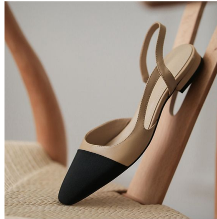
Zapatoz con tacón de bloque