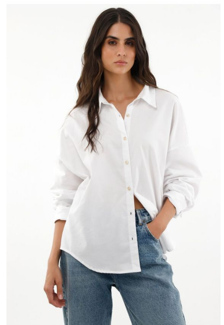
Camisa manga larga clasica