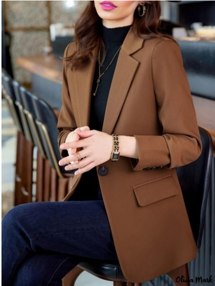
Blazer Olivia Ref: Olivia Precio: $130.000